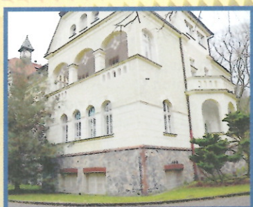
Oddělení následné péče Ryjice