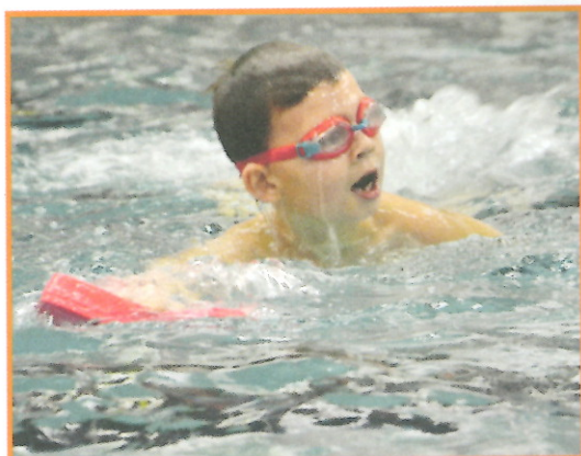
Učím se plavat