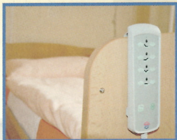
Dotace Ústeckého kraje na nová lůžka