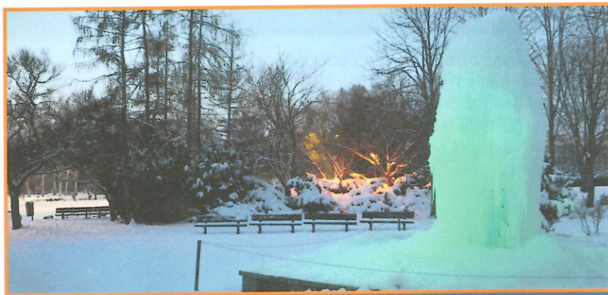
Ledový strom na Severní Terasě v Ústí nad Labem