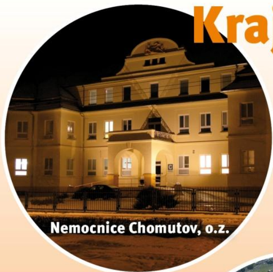
Nemocnice Chomutov, o.z.