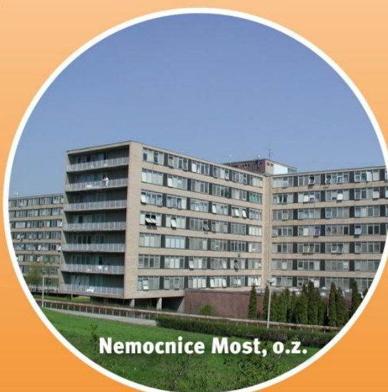
Nemocnice Most, o.z.