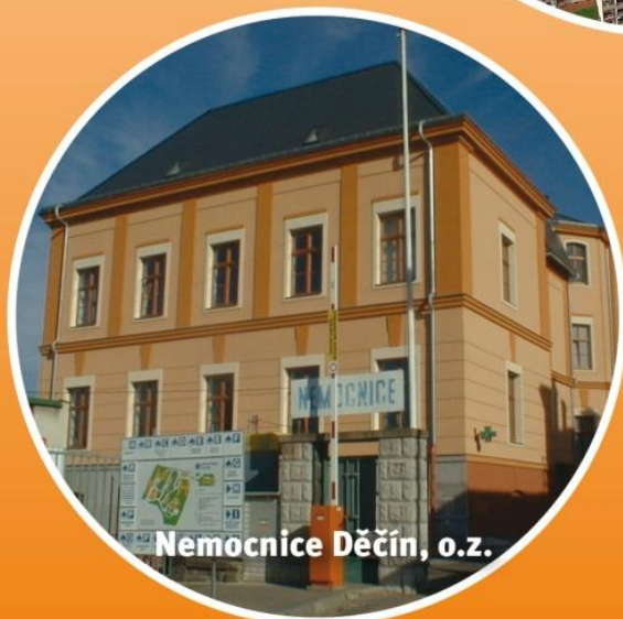
Nemocnice Děčín, o.z.