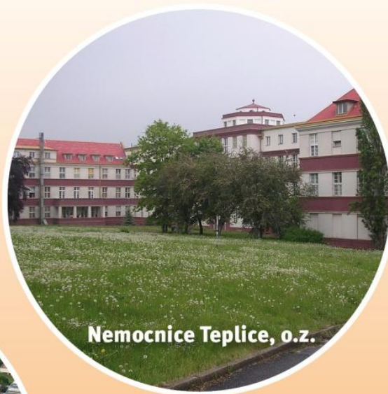
Nemocnice Teplice, o.z.