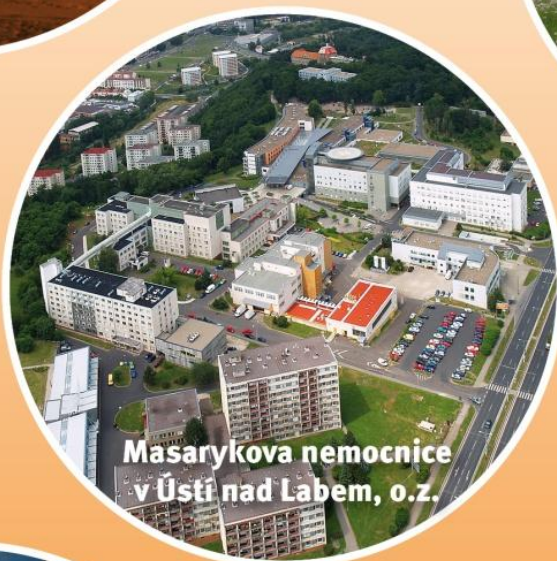
Masarykova nemocnice v Ústí nad Labem, o.z.