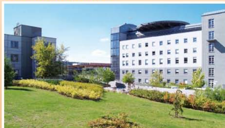
Nemocnice Most, o.z.