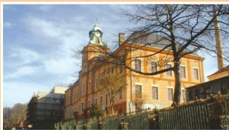
Nemocnice Teplice, o.z.