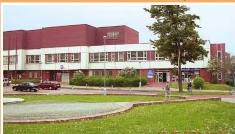
Masarykova nemocnice v Ústí nad Labem, o.z.