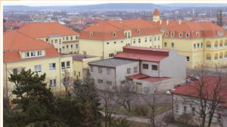
Nemocnice Děčín, o.z.